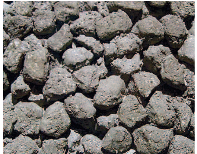
写真1 ポーラスコンクリート

ポーラスコンクリートは空隙体であるため、その強度は空隙率の大きさや空隙径の大きさにより変化する。